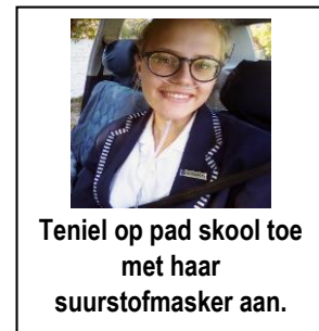
Teniel op pad skool toe met haar suurstofmasker aan.