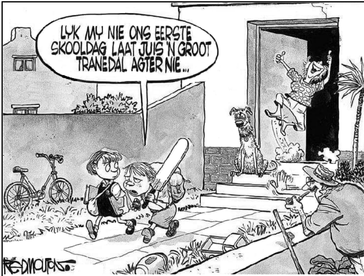
[Verwerk uit Die Burger , 17 Januarie 2018]