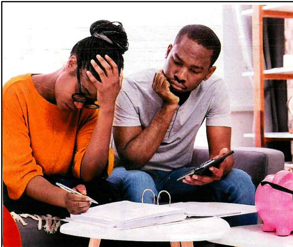
[Sethwantsho se qotsitse ho Move 17 Mmesa 2017] [50]