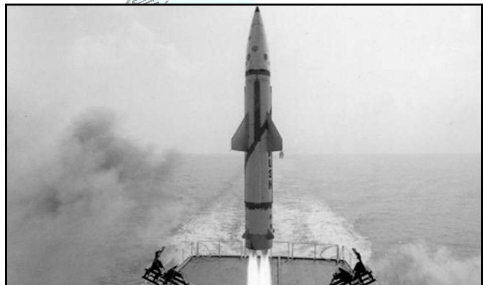
[Tshi bva kha google images ]