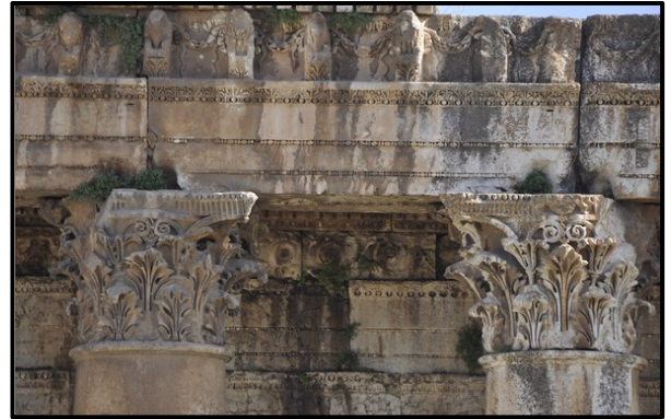
Detail van Bacchus-tempel , argitek onbekend (Baalbek, Libanon), 3 de eeu VHJ.