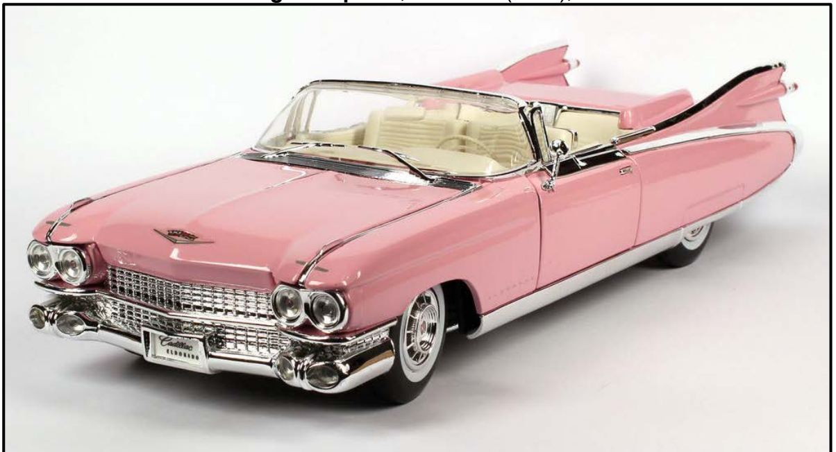
FIGUUR I: Cadillac Eldorado , Pop Design (VSA), 1959.

Skryf 'n vergelykende opstel (ten minste EEN bladsy) waarin jy bespreek hoe FIGUUR H en FIGUUR I kenmerkend is van die ontwerpbewegings wat hulle verteenwoordig.