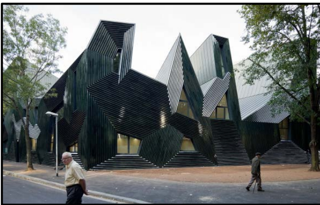
FIGUUR G: Mainz-sinagoge deur Manuel Hertz Architects (Duitsland), 2010.