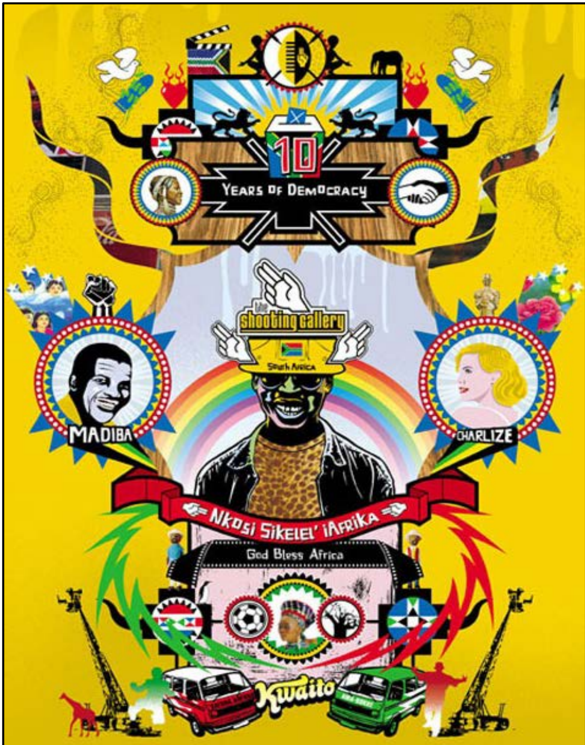
FIGUUR C: Makarapa deur Plan International (Suid-Afrika), 2015.