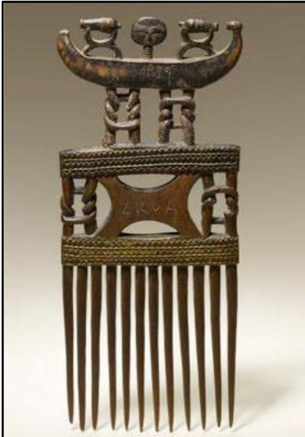
FIGUUR D: Bridshaarkam deur Asante-kunstenaar (Ghana), 1932.

3.1 Verwys na FIGUUR D en FIGUUR E hieronder en beantwoord die vrae wat volg.