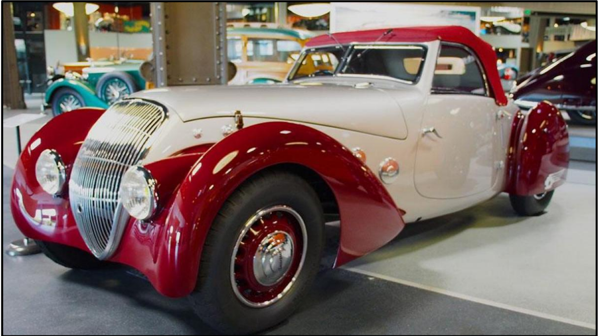
FIGUUR H: Bugatti Tipe 57 , Art Deco (Italië), 1934 tot 1940.