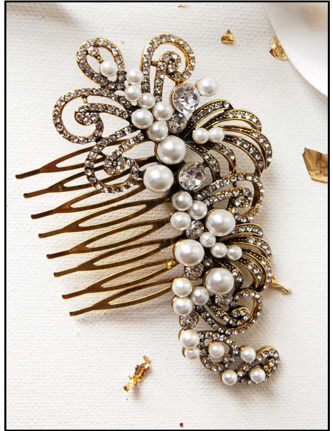
FIGUUR E: Bridshaarkam met Pêrelfiligraanwerk deur Highland Angel (Skotland), 2016.

Skryf 'n kort opstel (ten minste EEN bladsy) waarin jy FIGUUR D met FIGUUR E vergelyk.