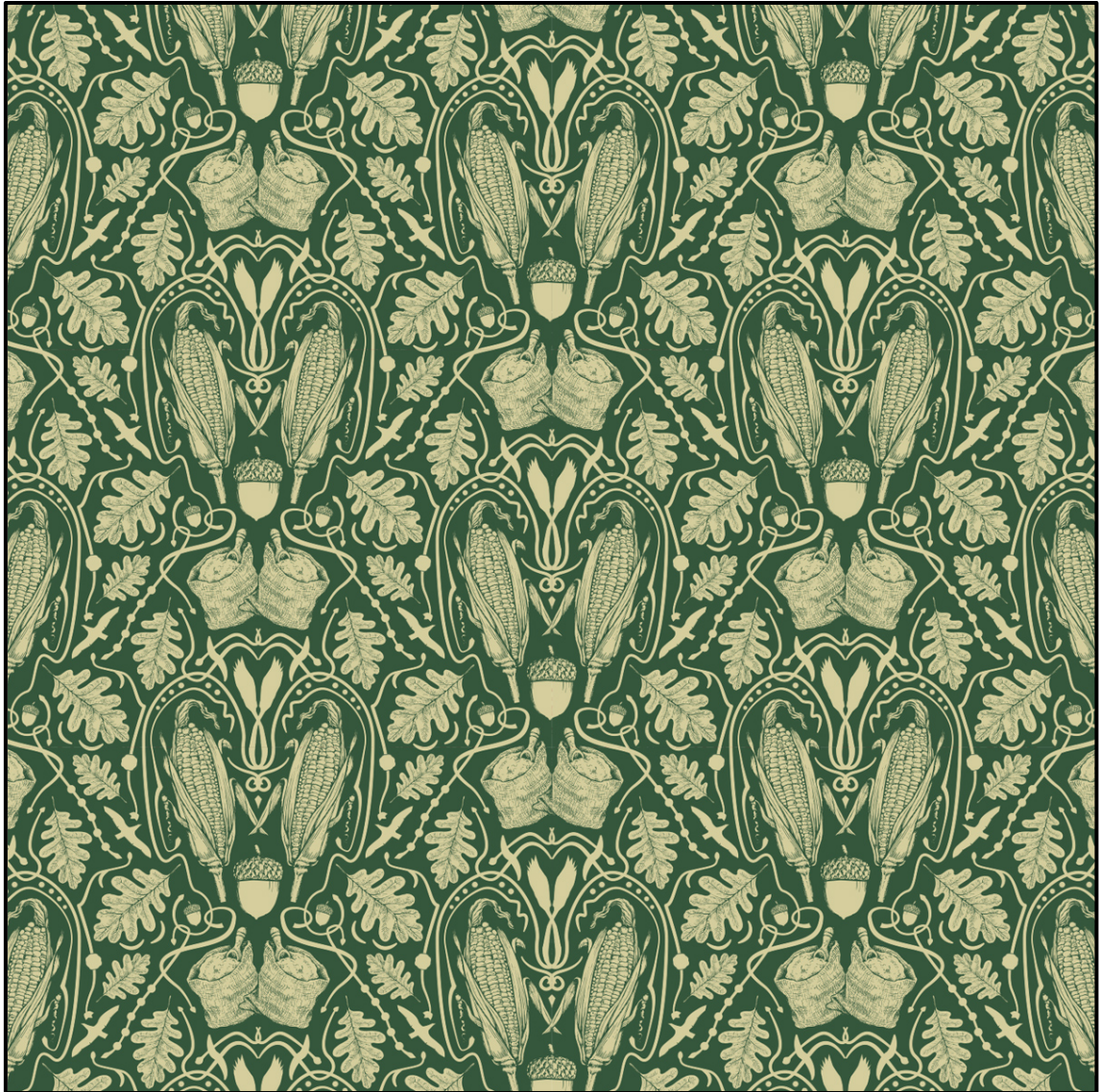
FIGUUR B: Heraldiese Mieliepatroon-muurpapierontwerp deur Quagga (Suid-Afrika), 2012.

Analiseer die gebruik van die volgende in FIGUUR B hierbo: