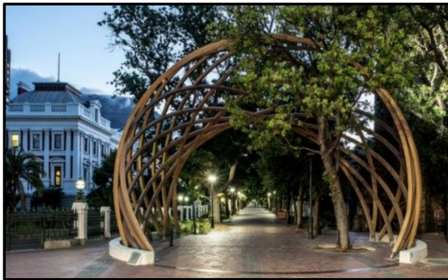
FIGUUR G: #ArchForArch-gedenkboog vir Aartsbiskop Desmond Tutu (Suid-Afrika), 2017.

Skryf 'n opstel (ten minste EEN bladsy) waarin jy die antieke Romeinse Boog in Volubilis, Marokko in FIGUUR F met die kontemporêre #ArchForArch vir Aartsbiskop Tutu in FIGUUR G, vergelyk.