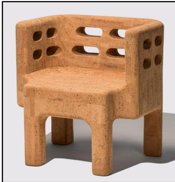
FIGUUR L: Stoel uit die Sobreiro-versameling deur die Campana Brothers (Brasilië), 2018. Die stoel is van kurk gemaak.

(Kurk is 'n materiaal wat uit die bas van die kurkeikeboom verkry word. Die bas word van die boom, wat nooit afgekap word nie, afgestroop om die kurk te oes. Kurk is omgewingsvriendelik, waterbestand en kan dryf.)