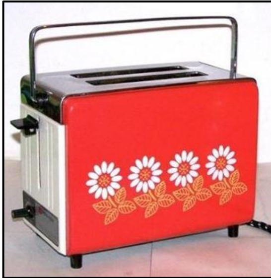
FIGUUR H: Toshiba-broodrooster (Pop-ontwerp) (Japan), 1960's.