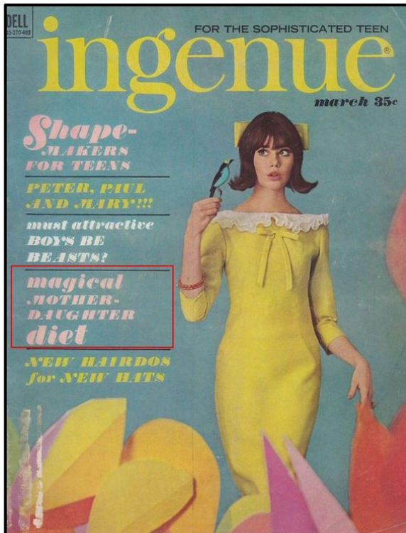
FIGUUR D: Ingenue -tydskrifvoorblad deur Dell Publishing Company (Londen), 1964.