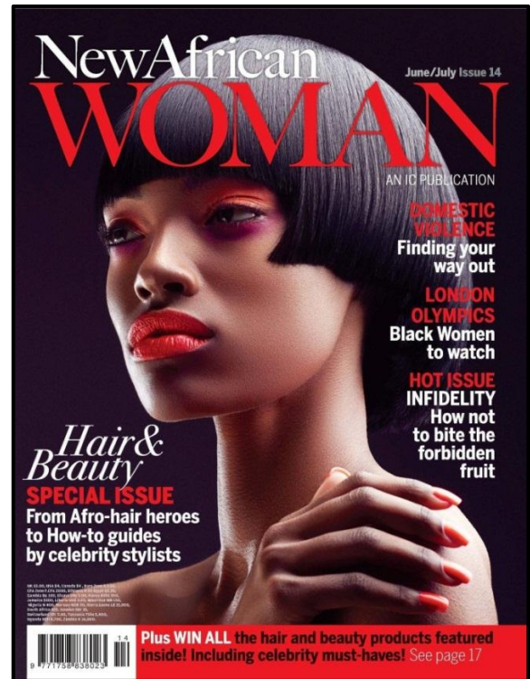
FIGUUR E: New African Women -tydskrifvoorblad deur IC Publications (Londen), 2014.

Vergelyk die tydskrifvoorblad in FIGUUR D met die tydskrifvoorblad in FIGUUR E.