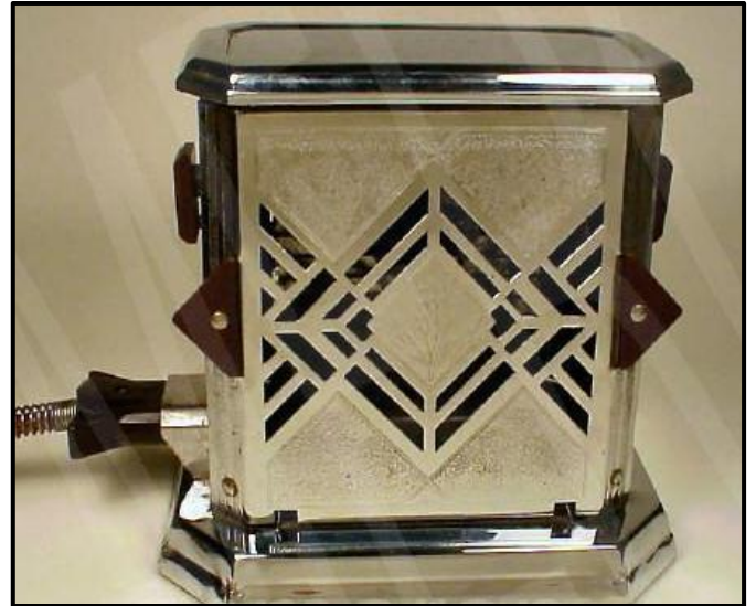
FIGUUR I: Fostoria-broodrooster vervaardig deur Bersted MFG Co (Art Deco) (VSA), 1930's.

Skryf 'n opstel (ten minste EEN bladsy) waarin jy die broodrooster in FIGUUR H met die broodrooster in FIGUUR I hierbo vergelyk. Verduidelik hoe die broodroosters tipies is van die bewegings waartoe hulle behoort.