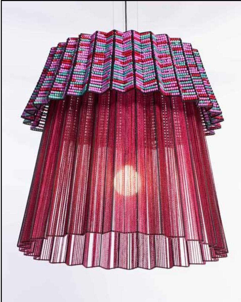
FIGUUR A: Tutu 2.0 Hangende Lig deur Thabisa Mjo (Suid-Afrika), 2017.

1.1.1 Analiseer die gebruik van die volgende elemente en beginsels in FIGUUR A hierbo: