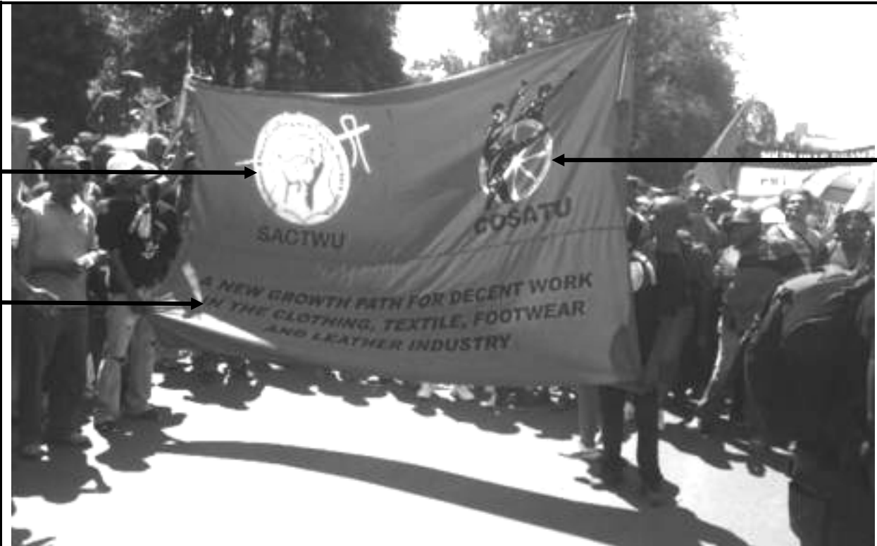
[Uit http://ewn.co.za/2015/10/07/Cosatu-marches-underway-in-CT-and-JHB . Toegang op 20 Januarie 2018 verkry.]

Die foto hieronder, deur K Mogale, het op die webblog van Eye Witness News verskyn. Dit toon lede van die Congress of South African Trade Unions (COSATU) en die South African Clothing and Textile Workers Union (SACTWU) wat op 7 Oktober 2017 in Kaapstad marsjeer.