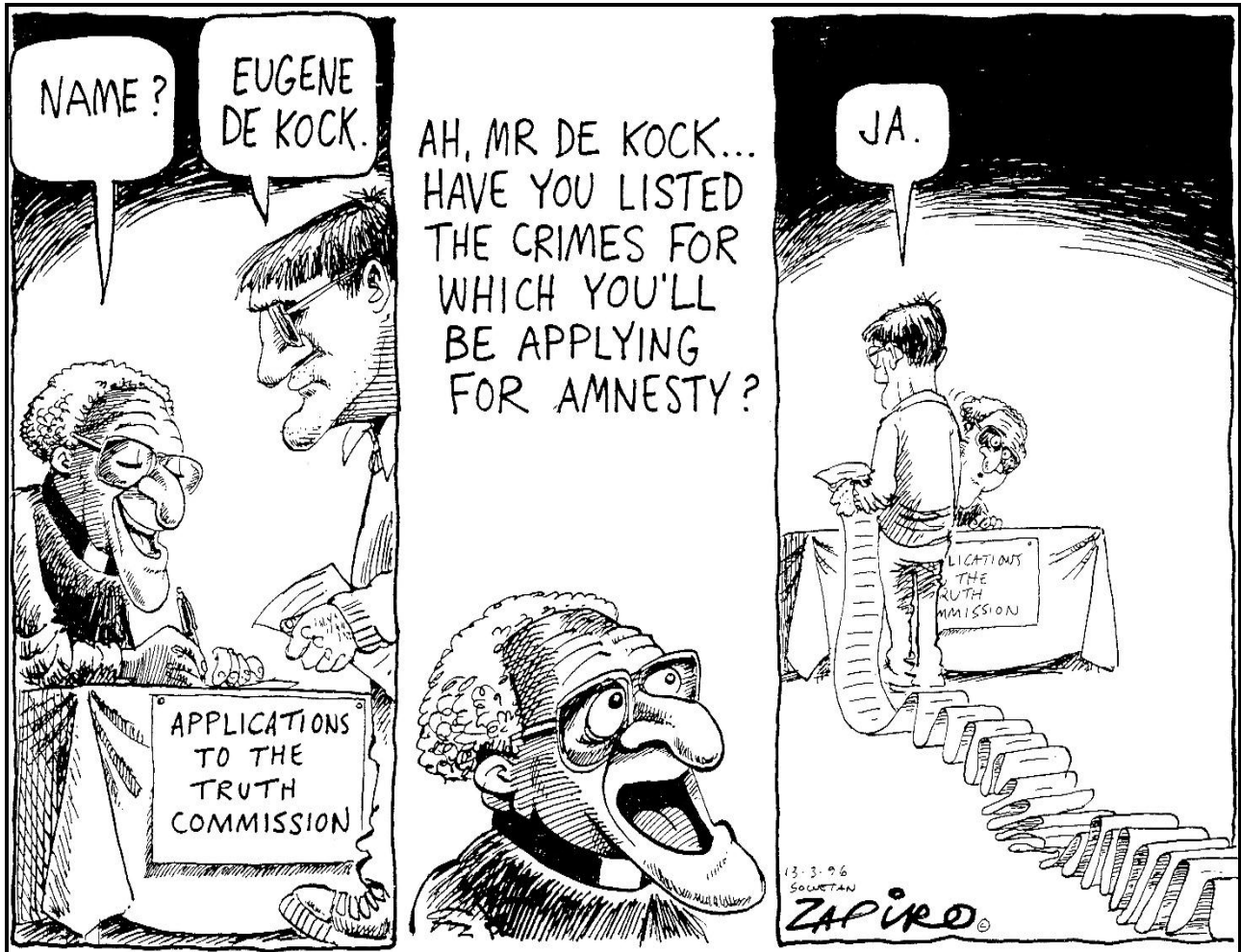
[Uit http://www.saha.org.za/news/2013/July/galley_eugene_de_kock.htm . Toegang op 12 Februarie 2020 verkry.]

Die spotprent deur Zapiro hieronder, beeld uit hoe Aartsbiskop Desmond Tutu, Eugene de Kock se aansoek om amnestie ontvang. Dit het op 13 Maart 1996 in die Sowetan verskyn.