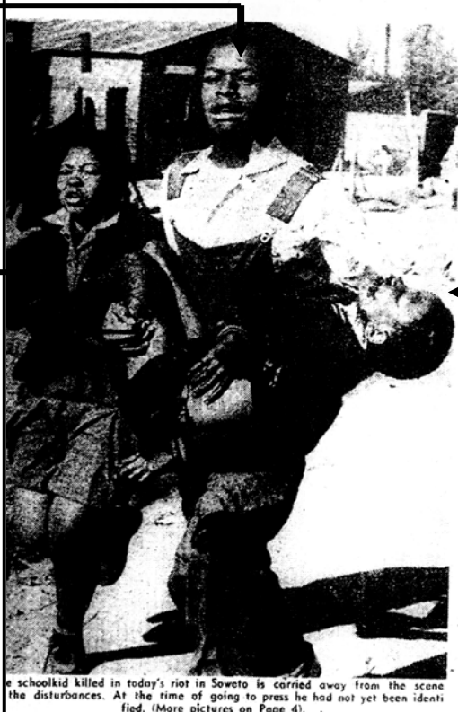
A schoolkid killed in today's riot in Soweto is carried away from the scene of the disturbances. At the time of going to press he had not yet been identified. (More pictures on Page 4).