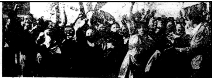
Students clench their fists in the "Black Power" salute as they march through Soweto streets.