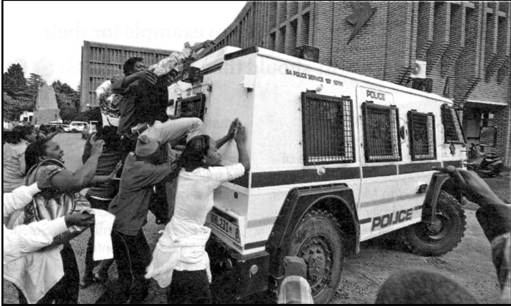
[Mothopo:Move, March 2014]