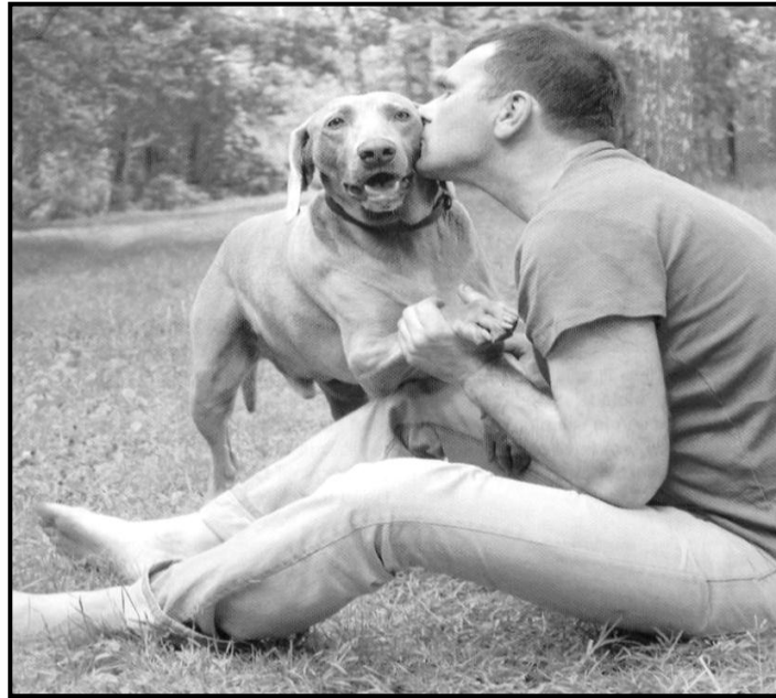
[Mothopo: Skyways, June 2015]