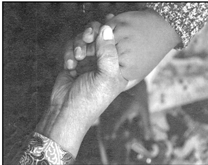
[Mothopo: Skyways, June 2015]