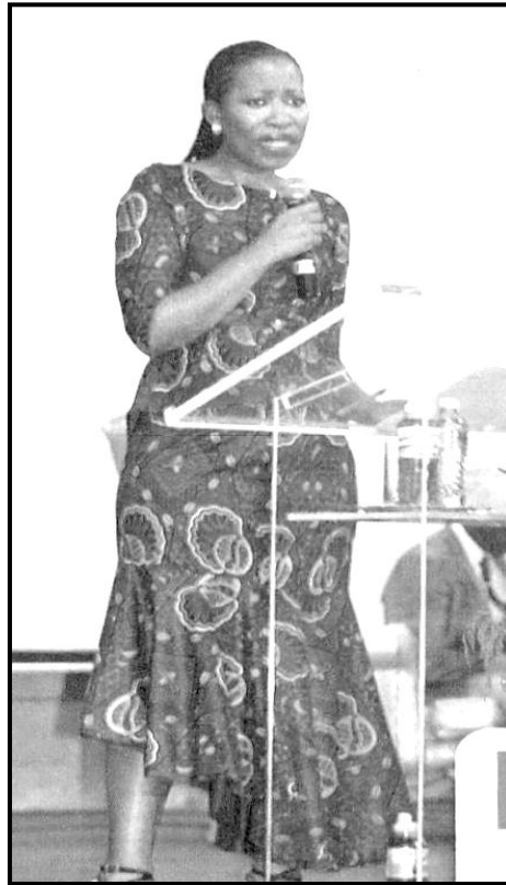
[Mothopo: Move , March 2014]