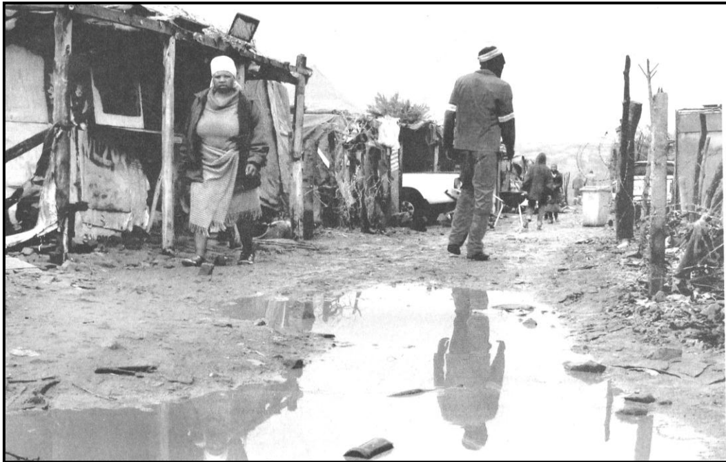
[Se nopotswe go tswa mo Pretoria News , 15 Diphlane 2018]

Motsana wa kwa ga lona o dula o tletse metsi a kgeleloleswe. Mokhanselara wa motsana wa lona o ne a bitsa pitso ya baagi go tla go buisana ka ga bothata jo, mme a go kopa go neelana ka puo mabapi le kotsi ya maemo ao le gore a ka fedisiwa jang. Kwala puo e o tlaa neelanang ka yona kwa pitsong eo.