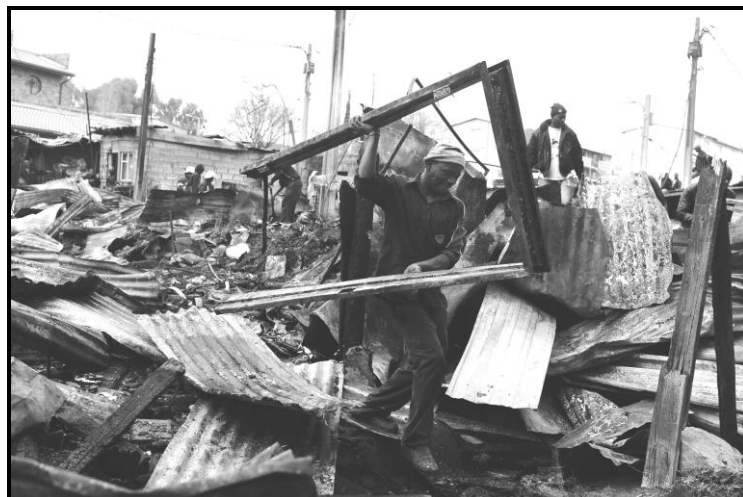
[Se nopotswe go tswa mo inthaneteng]

Mogwaafatshe kgotsa mokhukhu wa bana bangwe mo sekolong sa lona o šwele lorelore, mme ba lathegetswe ke dithoto tsa bona tsothe. Kwalela rragwebo mongwe mo tikologong ya lona o mo kope go thusa bana ba gore ba tswellele ka go tseno sekolo.