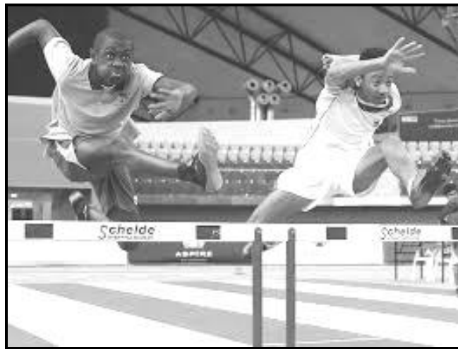
[Se nopotswe go tswa mo inthaneteng]

O fentse kgaisano ya go tlhopha baatlelete ba ba yang go emela Aforikaborwa kwa dikgaisanong tsa kontinente ngwaga e e tlang. Kwalela tsala ya gago o mmolelele ka ipaakanyo ya gago mo dikgaisanong tseo le maikaelelo a gago ka ga tsa kontinente.