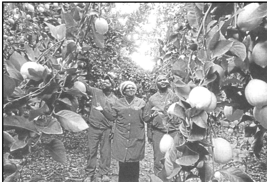
[Se nopotswe go tswa mo Sunday Times , 12 Motsheganong 2019]