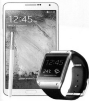
GALAXY Note 3 + Gear